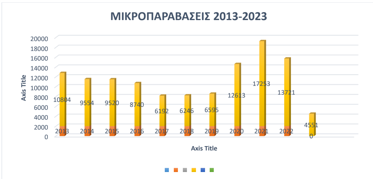
ΓΡΑΦΗΜΑ 2 : Στατιστικά στοιχεία για αριθμό μικροπαραβάσεων από 2013-2023.

Η Αστυνομία της Κύπρου διαθέτει στατιστικές για το έγκλημα στην Κύπρο αλλά δεν έχει στατιστικές για τα αδικήματα που διαπράχθηκαν από αλλοδαπούς η μετανάστες.