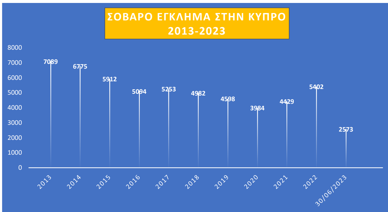
ΓΡΑΦΗΜΑ 3 : Στατιστικά στοιχεία για αριθμό Σοβαρών υποθέσεων από 2013-2023.

Ο πιο πάνω πίνακας παρουσιάζει τις υποθέσεις Σοβαρού εγκλήματος από το 2013 μέχρι τον Ιούνιο του 2023. Στον πίνακα αυτό μπορούμε να δούμε ότι το 2013 υπήρχε ο μεγαλύτερος αριθμός υποθέσεων 7089 ενώ τον επόμενο χρόνο 2014 μειώθηκαν σε 6775. Εάν υποθέσουμε ότι από το 2015 άρχισε μεγαλύτερη εισροή προσφύγων στην Κύπρο και θα αναμέναμε αύξηση του Σοβαρού εγκλήματος αυτό δεν επαληθεύτηκε. Το 2015 το Σοβαρό έγκλημα μειώθηκε ακόμα περισσότερο σε 5912 ενώ τα χρόνια που ακολούθησαν οι υποθέσεις μειώθηκαν και παρέμειναν σε σταθερό επίπεδο. 93