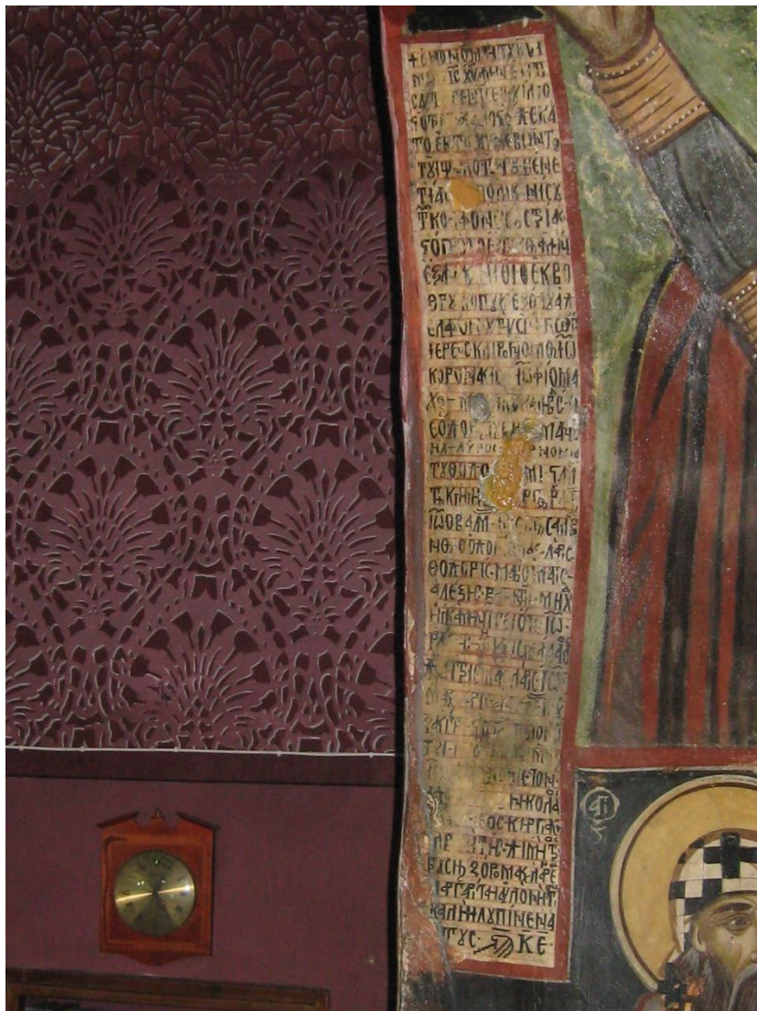
Η Κτητορική επιγραφή στην κόγχη του ιερού του ναού του Αγίου Στεφάνου Σκριπερού.