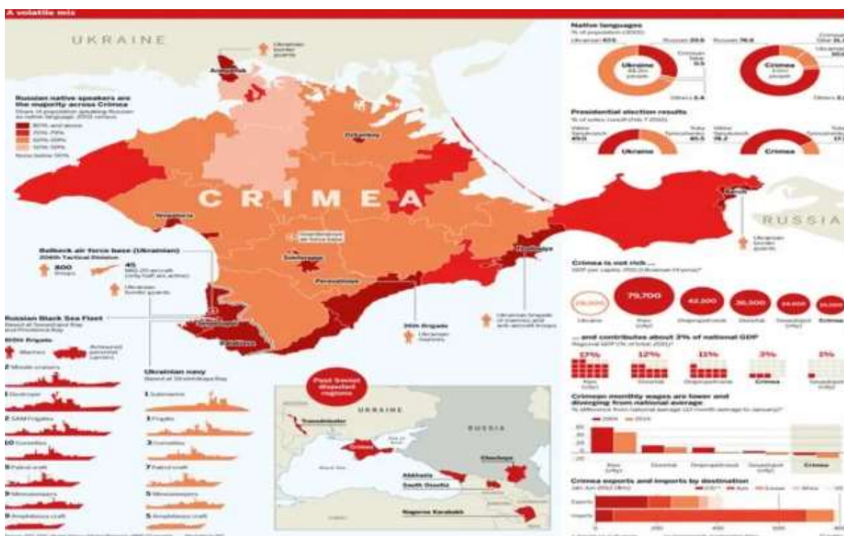
Εικόνα 2 Συνεκτικός Χάρτης Πληροφοριών για την Κριμαία. Πηγή: https://eurasiangeopolitics.com/ukraine-maps/ft-crimea-divided/#main . Πρόσβαση: 10/10/2023

πληθυσμός της ανέρχεται σε 2.024.000, εκ των οποίων το 58,3% είναι Ρώσοι και μόλις το 24,3 Ουκρανοί, ενώ 12% είναι Τάταροι της Κριμαίας (State Statistics Committee of Ukraine, 2001). Η ρωσική γλώσσα είναι συντριπτικά κυρίαρχη στην περιοχή, καθώς χρησιμοποιείται ως μητρική, σε ποσοστό 99,7% από τους Ρώσους, 40,4% από τους Ουκρανούς και 93% από τους Τατάρους της Κριμαίας (State Statistics Committee of Ukraine, 2001). Ως το 2011 προσέφερε στο Ουκρανικό ΑΕΠ, μόλις 3%. Την περίοδο 1995 – 2013, ο μέσος μισθός βρίσκεται σταθερά πολύ κοντά στον μέσο εθνικό 22 . Από την ένταξή της στην Ρωσική επικράτεια, η Κριμαία απορροφά κρατικά κεφάλαια, που έως το 2022, αναμενόταν να είχε υπερβεί τα 13 δις δολάρια (The Moscow Times, 2019).