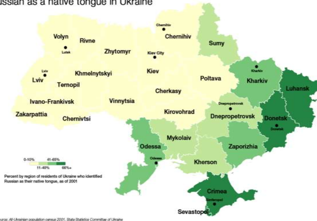
Εικόνα 3 Τα Ρώσικα ως μητρική γλώσσα στην Ουκρανία. Πηγή: http://america.aljazeera.com/multimedia/2014/2/mapping-ukraine-sidentitycrisis.html Πρόσβαση: 11/10/2023