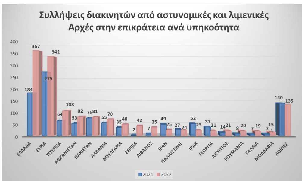
Εικόνα 4: Συλληφθέντες Διακινητές στην Ελληνική Επικράτεια ανά υπηκοότητα, 2021-2022