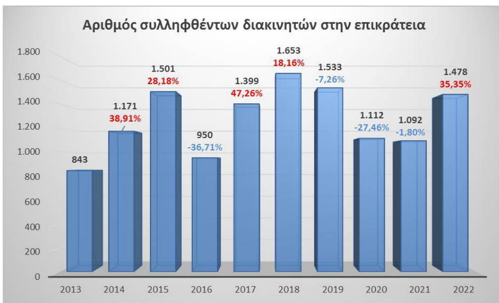
Εικόνα 3: Αριθμός Συλληφθέντων Διακινητών στην Ελληνική Επικράτεια, 2013-2022