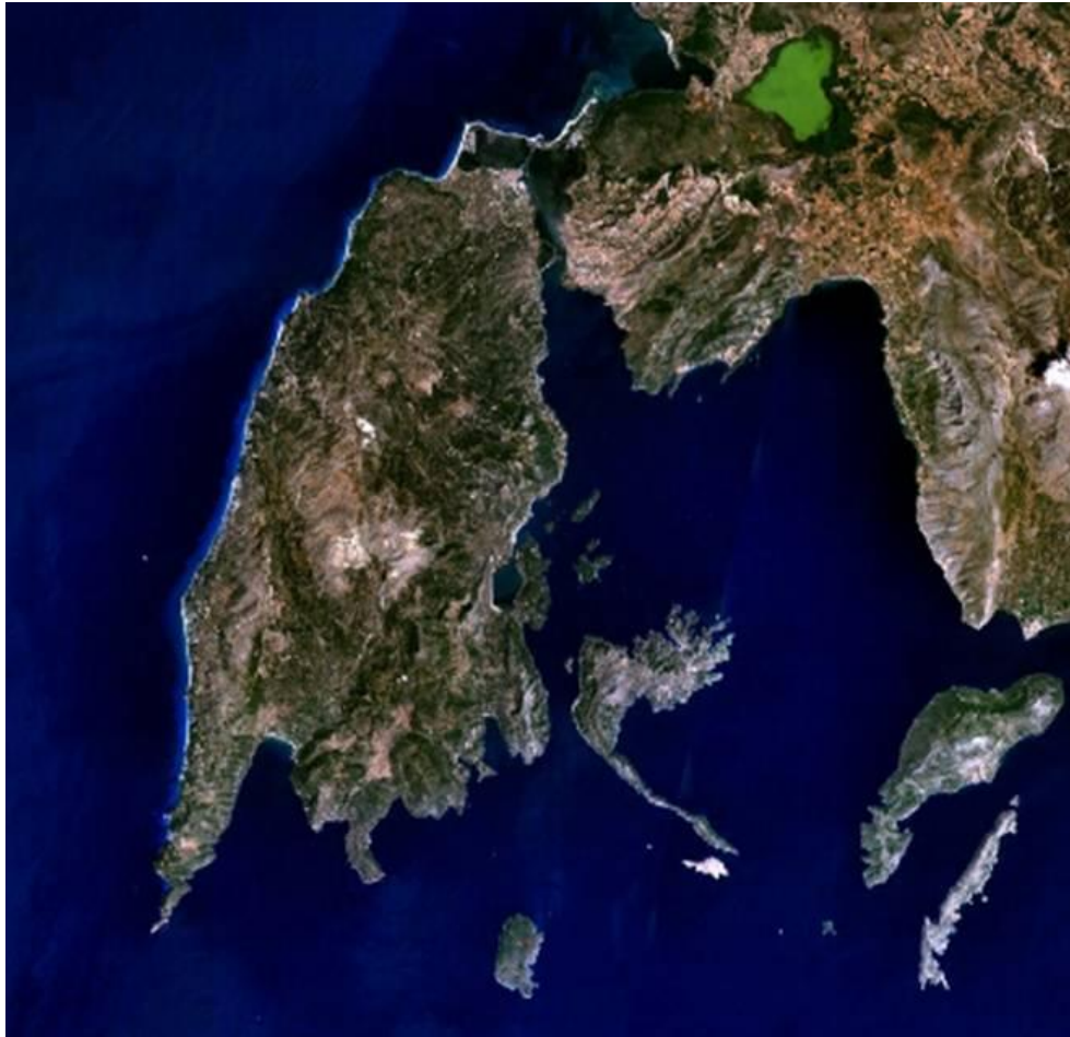
Εικόνα 1 η : Λευκάδα