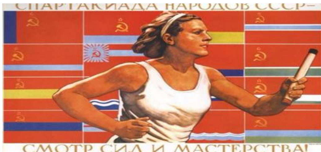
Εικόνα 2. Σοβιετική αφίσα του 1972

Τέλος, υπάρχουν πολλές αντίστοιχες αφίσες και από άλλα κράτη του ανατολικού μπλοκ (ιδίως Ανατολική Γερμανία, Τσεχοσλοβακία, Πολωνία, Βουλγαρία), με κοινό εικαστικό λεξιλόγιο (σοσιαλιστικός ρεαλισμός, «υγιές» αποσεξουαλικοποιημένο σώμα, σημαίες/εμβλήματα, σύνδεση αθλητισμού-νεολαίας-κράτους).