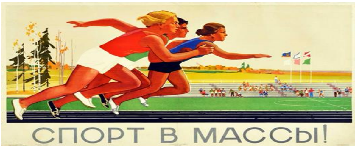
Εικόνα 3. Σοβιετική αφίσα του 1976