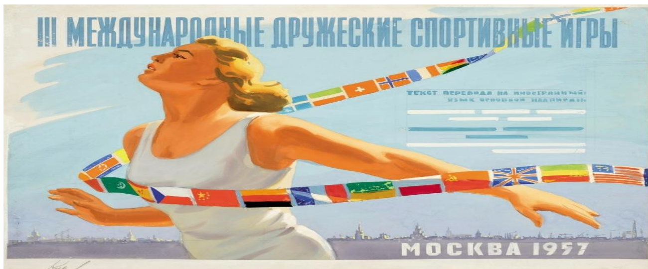
Εικόνα 4. Σοβιετική Αφίσα του 1980