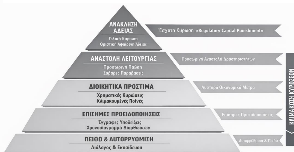
Πίνακας 5-2 Η Ρυθμιστική Πυραμίδα της Responsive Regulation