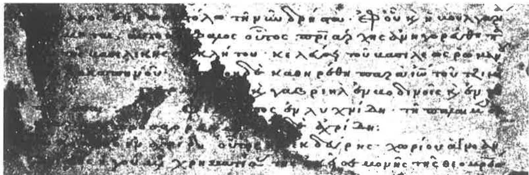
Εικ. 10. Λεπτομέρεια του φ. 407 v του χφ Par. gr. 880. (Μουτσόπουλος).