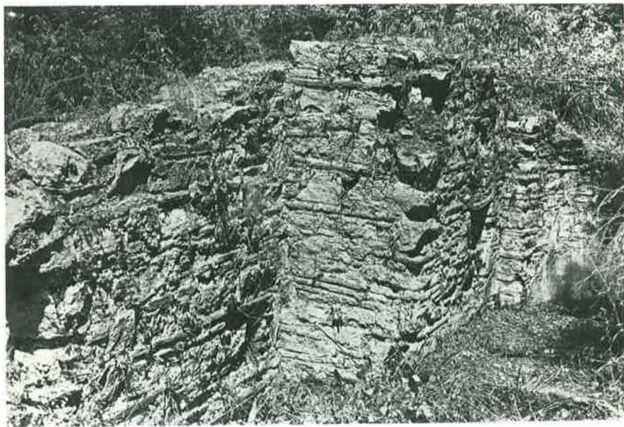
2. Βόρειος τοῖχος τοῦ ναοῦ (τοιχοδομία)