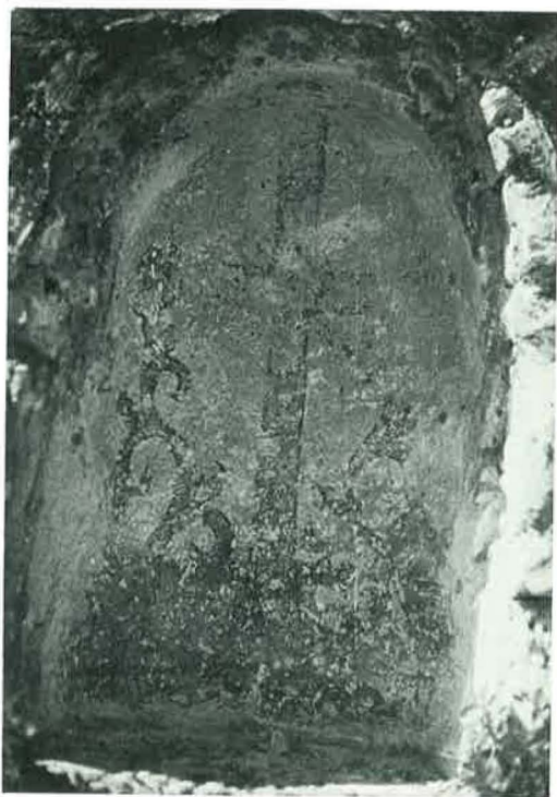
4. Ὁ φυλλοφόρος σταυρός τῆς κόγχης