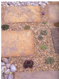
Εικόνα 6: Συνδυασμός χαλικιών με πέτρα και φύτευση

διαστάσεις και μετά βοτσαλοποιούνται σε μεγάλες περιστρεφόμενες βαρέλες μέχρι να επιτευχθεί το επιθυμητό “στρογγύλεμα”. Ακολουθεί ο τελικός διαχωρισμός ανάλογα με την διάσταση. Βότσαλα χρησιμοποιούνται για διακόσμηση κήπων, εδαφοκαλύψεις, βοτσαλωτά δάπεδα. Εξωτερικοί χώροι χωρίς αυτοκίνηση μπορούν να αλλάξουν κυριολεκτικά πρόσωπο, αλλά και την αισθητική όλου του χώρου, καλυπτόμενοι με βότσαλα-ψηφίδες (βλ. εικ. 5,6) .