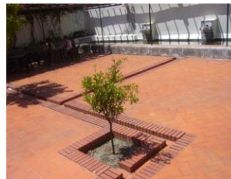
Εικόνα 8: Πλακόστρωτο από κεραμικά πλακάκια

Οι τραβερτίνες και οι πωρόλιθοι προέρχονται από ασβεστολιθικές αποθέσεις (ιζηματογενή πετρώματα). Η παρουσία των ορυκτών στο πέτρωμα, όταν βρίσκονται σε ικανή ποσότητα, επηρεάζει τις ιδιότητες και το χρώμα του πετρώματος. Τα έγχρωμα συστατικά προσδίδουν χαρακτηριστικές αποχρώσεις.