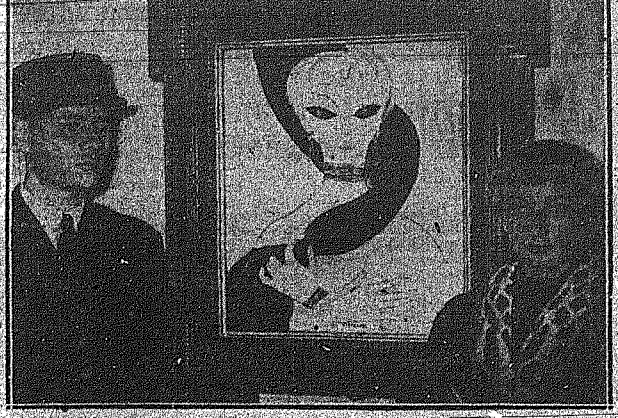
Το πλέον πολυτίμητον εύχρονον έργον τέχνης είναι άσφαδος κ. Η. Κυρία με το 'Αβαντίνα Μάτις, αυτοπροσώπως της Παρισιακής Γκαλερίας Μαρσύ Ντελάν...