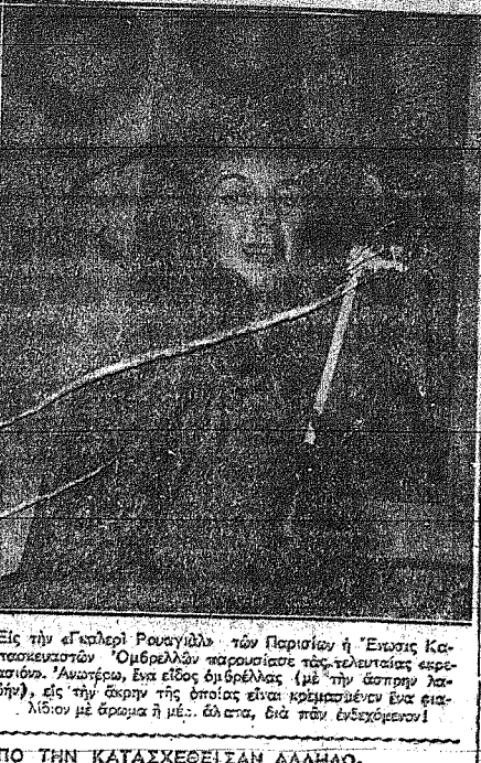
Είς την ε'ερρη Ρουαίλλη των Περίων η Έκταξ Κατασκευαστών Ουβρέλλων παρουσιάζει τα τελευταία εφευρέματα. Άνωθεν, ένα είδος ουβρέλλας (με την άσπρη λαβή), είς την άσπρη της οποίας είναι κρημνισμένοι ένα εκατόν...