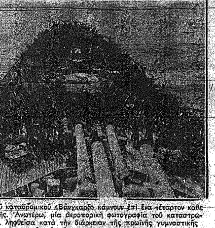
Οι άνδρες του Βρετανικού καταδρομικού «Βανγκαρντ» κάμουν επί ένα τάραντο...