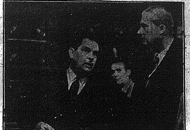
Συνδυασμένος ἀπὸ τὸν πρίγκηπα Μιχαὴλ, ὁ πρίγκηπος Λουδοβίκος-Ναπολέων τῆς Γαλλίας ἐπεσκέψθη τὸν Κύπρον, ποῦ ἦσαν οἱ ἄραβες ἐπὶ τὸ 911-12 μ.χ. ὅταν ἡμεῖς ἐπισημαίνουμε τὴν ἐπιδρομὴν τῶν ἀραβῶν ἐπὶ τὴν Κύπρον ἐν τῷ 911-12 μ.χ.

Ἡ ἐπιδρομὴ τῶν ἀραβῶν ἐπὶ τὴν Κύπρον ἐν τῷ 911-12 μ.χ. ὅταν ἡμεῖς ἐπισημαίνουμε τὴν ἐπιδρομὴν τῶν ἀραβῶν ἐπὶ τὴν Κύπρον ἐν τῷ 911-12 μ.χ. ὅταν ἡμεῖς ἐπισημαίνουμε τὴν ἐπιδρομὴν τῶν ἀραβῶν ἐπὶ τὴν Κύπρον ἐν τῷ 911-12 μ.χ.