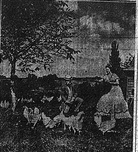
Είς τον Πύργον της Κορυμειά, διακρίθων τον γνωστό Παρισινό σχεδιαστή μόδας Ζακ Ζακ, γυρνώντας μερικά σκεπτά της νέας ταινίας με θέμα την Κύριον με τας Καμελίας...