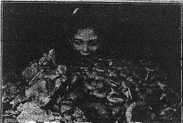
Εἰς τὸ Ἐθνικὸν Μουσεῖον Φυσικῆς Ἱστορίας...