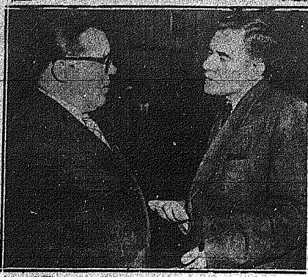
Η Διευθύντρια Έπιτροπή της Γ. Συνέλευσης του ΟΗΕ απέρριψε την Ρωσική αίτηση, όπως αντιπροσώπων της Ερυθράς Κίνας και της Β. Κορέας μετατόμισε τις συζητήσεις...