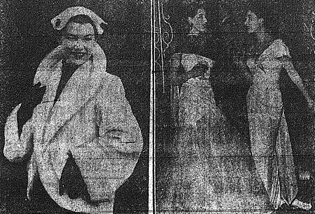
Οι Άγγλικαι Οίκοι Μόδας εξακολουθούν να πασαρώνουν μοντέλα της Στέφενς. Άνωτέρω, ά σιστέρι, μία άσηπη άνοχότατη ζαντέτα...