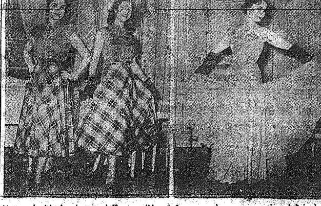
Λοιπότερα: Άπο θρονατάτα και ίδια μοντέλλα σε διαφορετικούς χροματισμούς. Δεξιά τού μοντέλλου «Σοφοκλούς».