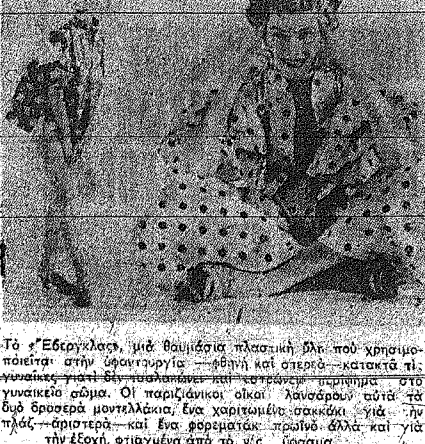
Το "Εβεργκλας", μια θαυμάσια πλαστική ύλη που χρησιμοποιείται στην υφαντουργία.