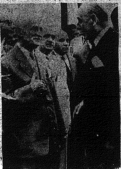
Η ΑΝΤΕΡΑ ΦΩΤΟΓΡΑΦΙΑ ΕΛΘΕΝ ΤΩΝ ΠΡΟΕΔΡΩΝ ΤΗΣ ΚΥΠΡΟΥ ΚΑΙ ΤΩΝ ΥΠΟΥΡΓΩΝ ΕΙΣ ΑΘΗΝΑΣ.

ΑΘΗΝΑΙ 21 (ΡΕΟΥΤΕΡ). — Ο κ. ΠΑΠΑΓΟΣ ΚΑΙ ΣΤΕΦΑΝΟΠΟΥΛΟΣ ΕΠΕΣΤΡΕΨΑΝ ΧΩΣ ΕΙΣ ΑΘΗΝΑΣ.