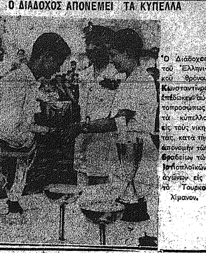
Ο ΔΙΑΔΟΧΟΣ ΑΠΟΝΕΜΕΙ ΤΑ ΚΥΠΕΛΛΑ