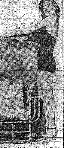
Η Πέγκυ Ντόουμ, η κατ'εξοχήν καλλιτεχνική ηθοποιός της Αμερικής