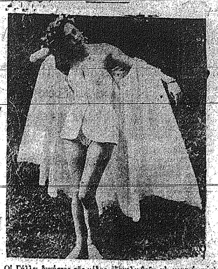
ΟΙ ΠΑΡΙΣΙΟΙ ΔΙΝΟΥΝ ΤΗΝ ΙΔΙΑΣ ΣΗΜΑΝΣΗΝ ΣΤΙΣ ΓΥΝΑΙΚΕΣ... ΕΙΣ ΤΟ ΠΑΡΙΣΙ ΕΠΙΚΡΑΤΟΥΝ ΤΑ ΜΙΚΡΑ ΓΥΝΑΙΚΕΙΑ ΚΑΠΕΛΑ