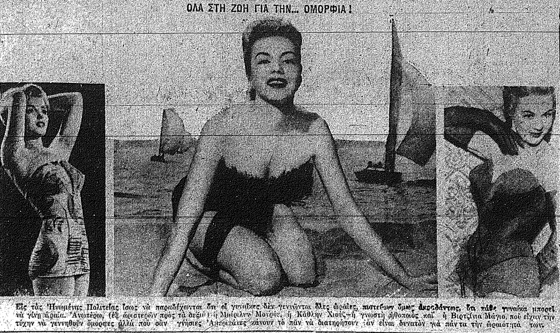
Είς τις Ηνωμένες Πολιτείες Ισού να παραβιβάσει... Η φωτογραφία απεικονίζει τον... Η φωτογραφία απεικονίζει τον...