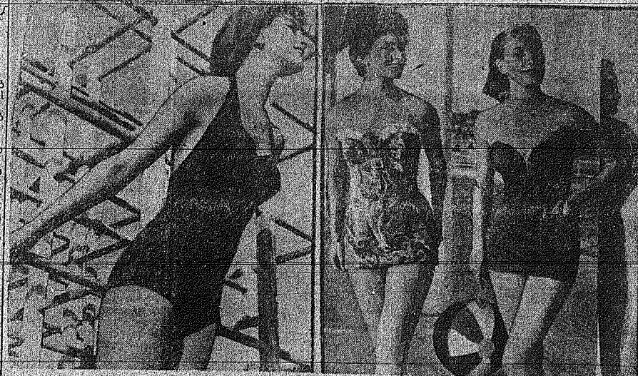
Μετά την κατάληξη των μαγικών αντέπαρ... Η βουρδουλιά είναι η πιο αβυσσική...