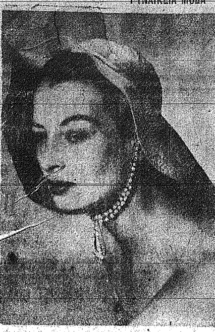
Ο Ντόρ λέγει... Ο θάνατος, όμως, είναι κακό πράγμα...