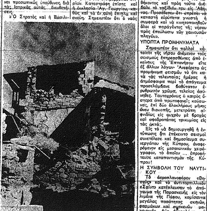
Αυτήν την εψίν παρουσιάζουν σήμεραν έλασι αι ερείπια εις τιν Στρούμπι.