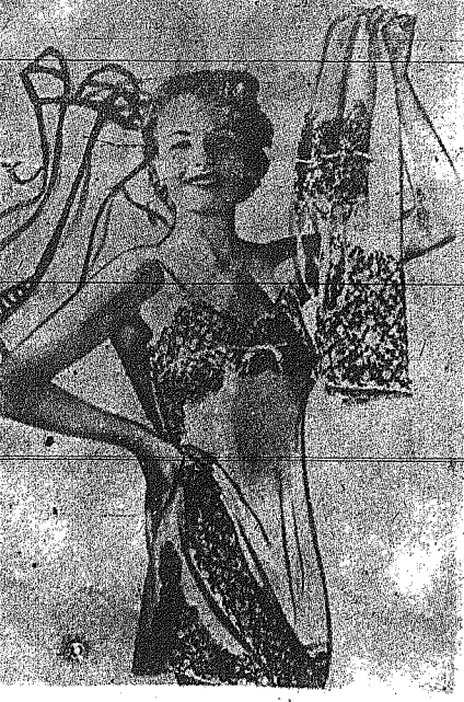
ΕΙΣ ΤΟ ΜΟΝΑΧΟΝ ΤΗΣ ΓΕΡΜΑΝΙΑΣ...