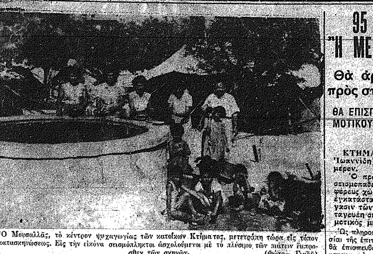
Ο Μουσαλλάς, τού κέντρου ψυχολογίας τών κατοίκων Κτήματος, μετετέθη τήν έρευνα είνε τήν έρευνα.

Τρία σώματα τής ΚΕΠΟ είνεκα δεκάτ είνε τήν Β' κατηγορία. - Μεθυσθών Τετάρτην νέαν συνέλευσιν τής ΚΟΠ.