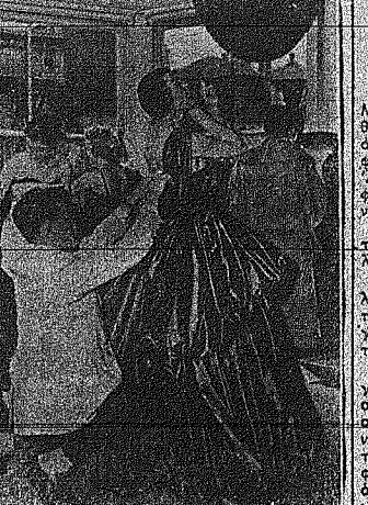
Οι δύο θύρες που κλείνουν... Τελευταία προετοιμασία... Οι δύο θύρες που κλείνουν...