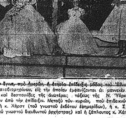
Εἰς τὴν Ν. Υόρκην ἔγνω, πρὸ ἡμερῶν, ἡ ἐπιτομή ἐπιθέσει μὲς τὸν ἑλληνικὸν Σύνδεσμον Ὑφασματουργίας, εἰς τὴν ὅποιαν ἐμεινάντες οἱ μαρκεῖν αἱ φασματουργαὶ κυριαὶ καὶ δεσπούντες τῆς ἀνατολῆς τῆς Ν. Υόρκης...