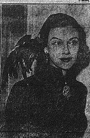
Από μια τελευταία επίδειξιν 'Ιταλικής μόδας'...