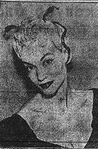
Ενώσεις Γάλλων κομμωτών παρουσίασε πρό ημερών τας τελευταίας κομμώσεως τού εις τόν Παρισινόν εστιονόριον...