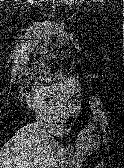
Εξ απορροής ενός δαυτού...