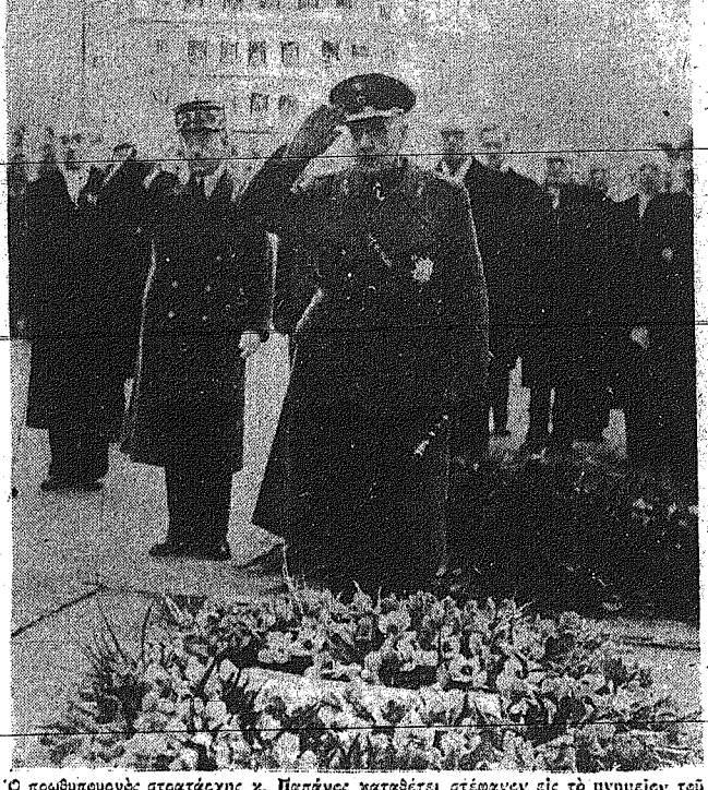
Ο πρωθυπουργός στρατάρχης Ν. Παπάγος κατάθετε στεφάνον εις τό μνημείον του Αγνώστου, εις Παρισίον. Είς τό δεξιόν τή στήλη διακρίνεται οι υπεύρυν κ.χ. Στεφανόπουλος και Σαρμάς...