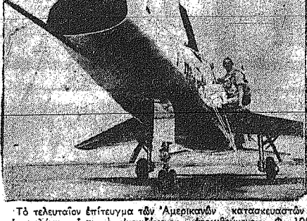
Το τελευταίο αέριοτυπο των Αμερικανικών κατασκευαστικών...