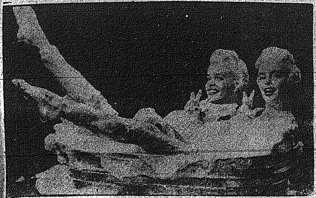
Ενας Αμερικανικός Όμιλος κατασκευών σπασιούνη για να βολέει δύο αδελφές να κάνουν το μπαφίο τους στην οδό της Νέας Υόρκης. Οι δύο αδελφές, για τον φόβο της μοιρίας...