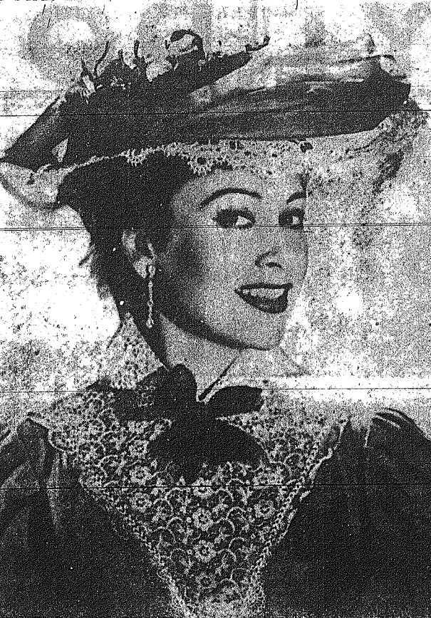
Ἐκτενὴ ἐνεσηρήθη ἀπὸ τὴν ὁμοτιμῶν τῆς ἀγγλικῆς τηλεοράσεως ἡ ἀσχηματικὴ Μαρτίν Κάρολ, ἡ ὁποία ἀφίκετο εἰς τὴν Κύπρον ἀπὸ τοῦ γαλλικοῦ κινηματογράφου. Κατὰ...