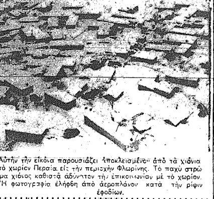
Αυτήν την εικόνα παρουσιάζει αποκλειστικώς... Αυτήν την εικόνα παρουσιάζει αποκλειστικώς...