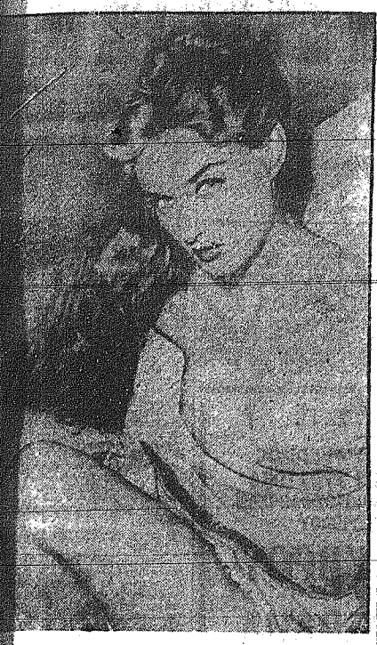
Η Στέφανη της Ρώμης γυμνάσια που έχει τον τίτλον χρυσού στα 400 μέτρα. Η Στέφανη της Ρώμης γυμνάσια που έχει τον τίτλον χρυσού στα 400 μέτρα.