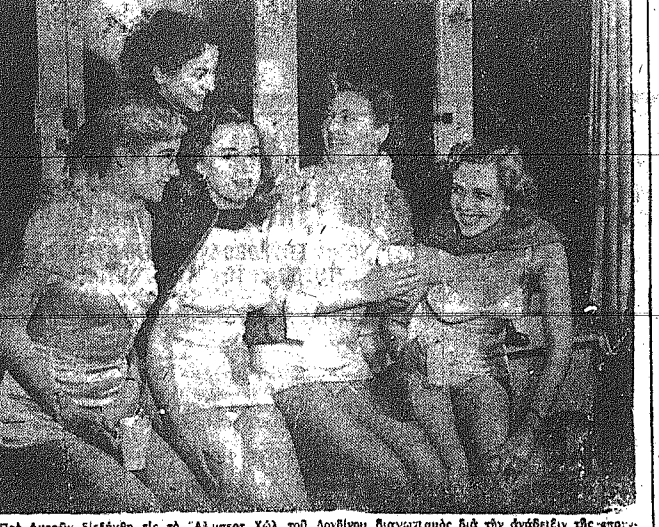
Πρό ημερών διετέλεσε εις το Άγιον Όρος...