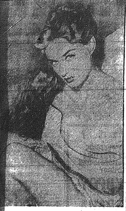
Το Στόντιν της Ρώμης γυρίστηκε με το έργο του φημισμένου φωτογράφου Μαρίου Μαρίου...