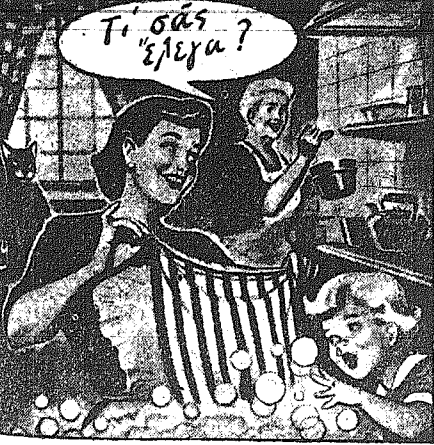
Η ΜΠΕΡΑ ΤΟ ΕΜΒΛΗ ΠΡΩΤΗ. Γυναίκες που χρόνια τώρα πλένουν...

Θαυμάσιο! Θαυματογόνο Tide! Κάνει όλα σας υποκαθαίρετα. Μπορείτε να το διαπιστώσετε στο ελάχιστο πλύσιμο σας.