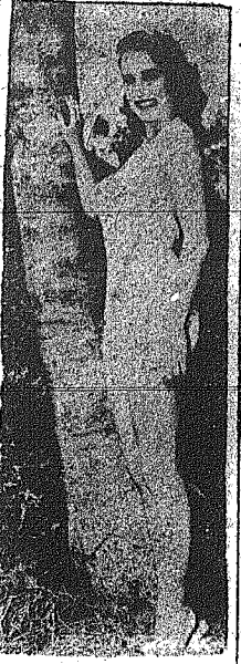
Η αδελφή Πασκουλίνα, κόρη του Πάπα Πιού του Β'...