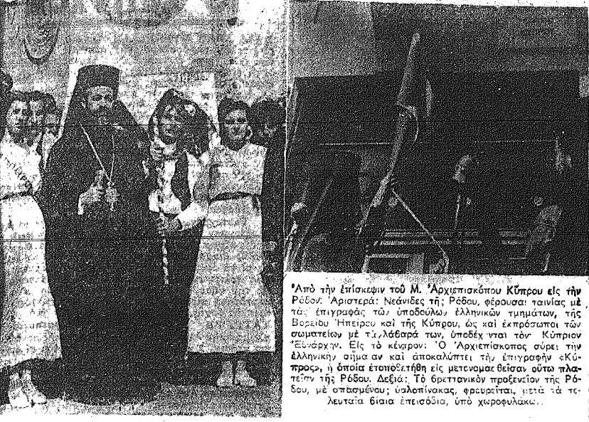
Από την επίσκεψιν του Μ. Αρχιεπισκόπου Κύπρου εις τὴν Ρέθυμνον. Ἀριστερὰ: Νεόνιες τῆς Ρέθυμνον, φορούσαι ταινίαν μετὰ ἐπιγραφὰς τῶν ὑποδούλων ἑλληνικῶν τμημάτων, τῆς Βορείου Ἡπείρου καὶ τῆς Κύπρου, ὡς καὶ ἐκπαιδευτικῶν τῶν ἀσμετικῶν μετὰ τὴν ἐλευθερίαν. Ἐξ ἄνω ἀριστερὰ: Ὁ Ἀρχιεπίσκοπος σὺν τῆν ἑλληνικῶν ἀσμετικῶν καὶ ἀποκαθίπτει τῆν ἐπιγραφὴν ἐΚπαιδευτικῶν τῶν ὑποδούλων ἐπὶ τῆν ἑλληνικῶν ταινίαν τῆς Ρέθυμνον. Δεξιὰ: Τὸ βρετανικὸν πρεσβείριον τῆς Ρέθυμνον, μετὰ σπουδαίους ὑπαλλήλους, ἐρευνεῖται μετὰ τὸ τελευταίον βίαιον ἐπιπέδον, ὑπὸ χειροφύλακας.