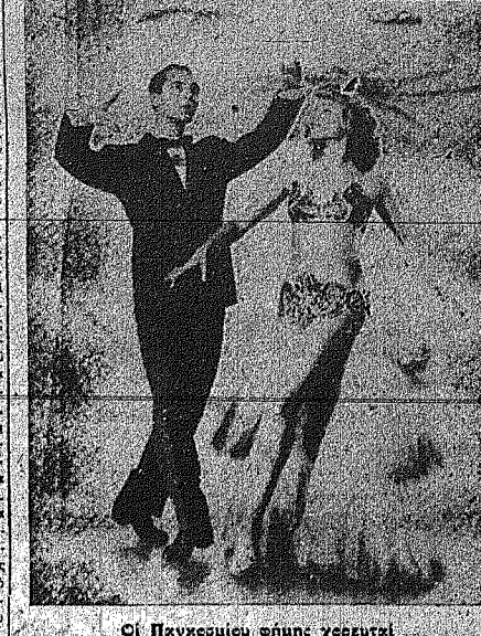
Οι Παιγκομίου φήνης χειρταί

Από τον Θίασμο που μας έρχεται τις 19 Νοεμβρίου και αρχίζει στο Ρογιαλ