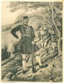
ΜΕΤΣΟΣ ΜΕΤΣΟΣ ΤΕΛΕΣΜΑ