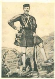
"Στρατός και οι Σέρβοι εις Κρούσια το 1813" "Soldiers and the Serbs in Kroussia in 1813"