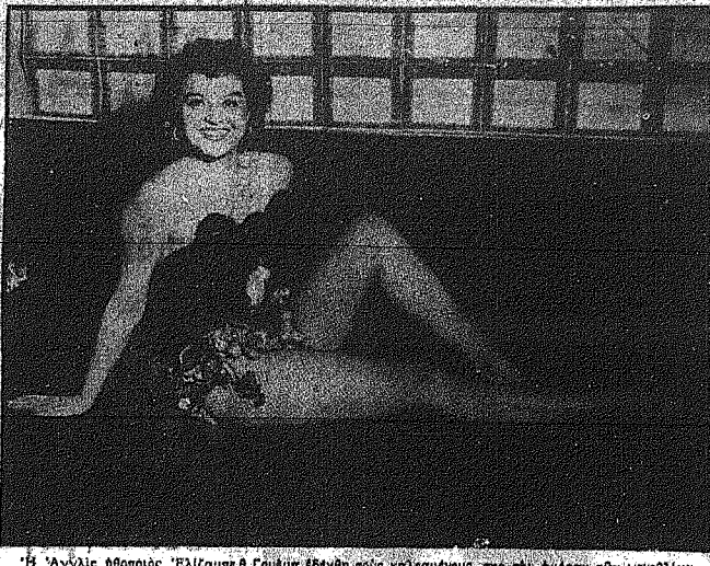
Η Άγγλις θεοποις Έλζαβεθ Γουίτνι... Η Άγγλις θεοποις Έλζαβεθ Γουίτνι...