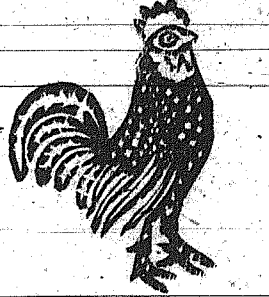
ΕΛΛΗΝΙΚΗ ΕΤΑΙΡΕΙΑ ΧΗΜΙΚΩΝ ΠΡΟΙΟΝΤΩΝ ΚΑΙ ΛΙΠΑΣΜΑΤΩΝ ΕΔΡΑ ΕΝ ΑΘΗΝΑΙΣ