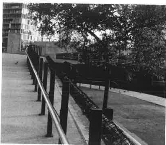
Εικόνα 5. Επινόηση παιχνιδιού με τα υλικά του πάρκου, Βαρκελώνη – Diagonal Mar park