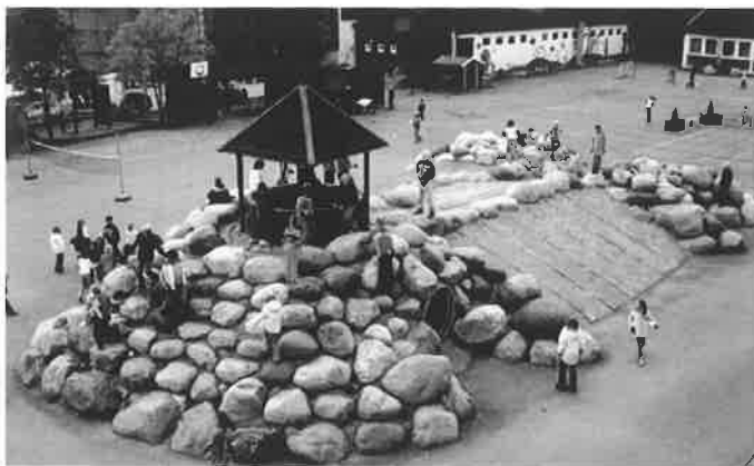
Εικόνα 7. Σχολική αυλή στο Όσλο, Manglerud Primary School, Oslo

Στην Ελλάδα τα σχολεία και οι αύλειοι χώροι τους σχεδιάζονται με βάση τις προδιαγραφές του Οργανισμού Σχολικών Κτηρίων και ο σχεδιασμός παραμένει ο ίδιος για περισσότερο από ένα αιώνα. Ο χώρος στο ελληνικό σχολείο προσφέρει στο εκπαιδευτικό περιβάλλον τη δυνατότητα να λειτουργεί με μόνο έναν και πάντα τον ίδιο τρόπο, από τον πόλο του εκπαιδευτικού προς εκείνο του μαθητή (Γερμανός, Παναγιωτίδου, Μπίκος, Μπότσογλου, Μπιρμπίλη, 2005). Δεν υπάρχει λειτουργική συνέχεια μεταξύ του εσωτερικού χώρου και του αύλειου χώρου του σχολείου ούτε υπάρχει δυνατότητα οι εκπαιδευτικές δραστηριότητες να επεκτείνονται στην αυλή.