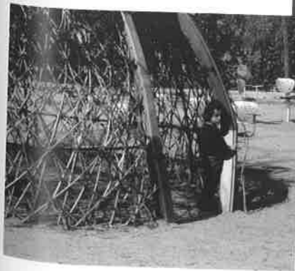
Εικόνα 2. Φωτο- γραφία παιδότοπου. Βαρκελώνη – Parc del centre del Poblenou