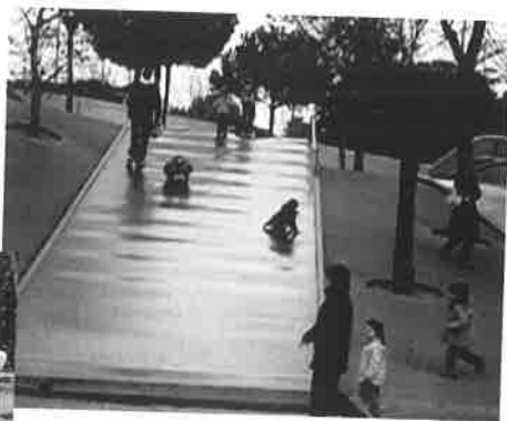
Εικόνα 1. Φωτο- γραφία παιδότοπου. Βαρκελώνη – Diagonal Mar park