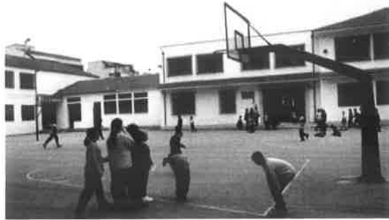
Εικόνα 9, Φωτογραφία ελληνικού σχολικού αύσιου χώρου.

Πάντως επισημαίνουμε ότι χρειάζεται να γίνουν πολλά βήματα ακόμα για να ικανοποιηθούν οι ανάγκες παιχνιδιού των παιδιών προς τη βελτίωση του τοπικού περιβάλλοντος και να συνδεθούν με κυβερνητικές πρωτοβουλίες και εθνικές στρατηγικές.