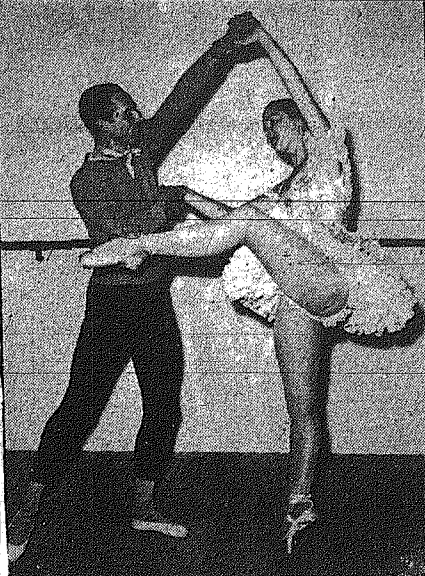
Ο χορευτικός και κορυφαίος χορευτής του μπαλέτου της “Οπερας του Μοναχού” Άλλαν Κούτερ, και η ηρώδινα μπαλέτου “Ιβάν Σκόριπ”, Ελισβετία Βέρνερ...