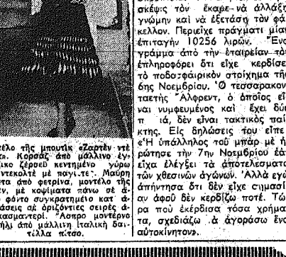
Μοντέλο της μουσικής εξουπνεί τον Νάβη. Κορράσι από μάλισιν αγγλικών έρωσι κεντημένην γύρω στ τελεστή με ποιντα. Μουσική φασάση από φερρινα μοντέλου της Λαβι, με κομμάτια πάνω με άσπρο φάση συγκρατημένη και άσπρισιασεί άφ άφριονίσι σείρσι άφ άφ κομμάτι. Άσπρο μοντέλου μονταίσι από μάλισιν Ιταλική δουλίλα κίτσο.

ΓΑΛΛΙΚΟ ΜΟΝΤΕΛΛΟΝ - Η Τύχη του δουλεύει ΠΑΡ' ΟΥΛΙΟΝ ΝΑ ΣΑΞΗ ΜΙΑΝ ΠΕΡΙΟΥΣΙΑΝ. ΠΟΥ Ε'ΧΕ ΠΕΤΑΞΕΙ ΕΙΣ ΤΑ ΣΚΟΥΠΙΔΙΑ