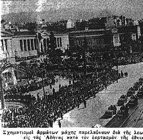
Σχηματικὸν ἀρμάτων μάχης παρελάσαν διὰ τῆς λεωφόρου Ἐλευθ. Βενιζέλου εἰς τὰς Ἀθήνας κατὰ τὸν ἐορτασμὸν τῆς ἐθνικῆς μῆς ἐπέτειου.