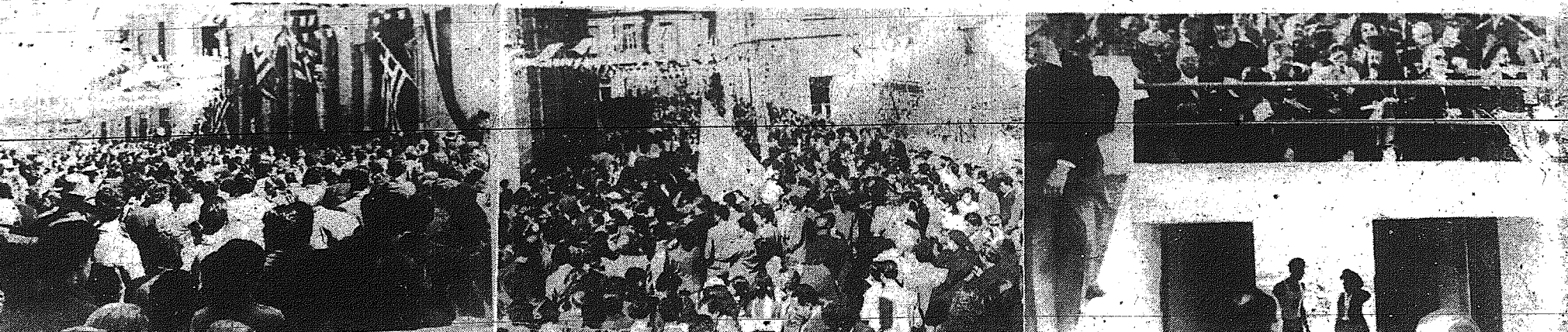
1) Τα πλήρη παρκαλεύσθη τὴν δεξολογίαν εἰς τὸς περί τοῦ ναοῦ Φανερωμένης χώρους. 2) Ἡ ἐκίνησις τῆς μεγάλης παρελάσεως. 3) Ἀπὸ τὸν ἀνευρηματικὸν ἐρτακίον εἰς τὰς στάσιον Γ.Σ.Π. Εἰς τὰς θέσεις τῶν ἐπισημῶν διακρίνονται ὁ Μ. Ἀρχιεπίσκοπος καὶ ὁ Γενικὸς Πρόεδρος τῆς Ἑλλάδος κ. Α. Παπαῆς, ἔχοντες ἐν τῷ μέσῳ τὴν μεγάλην εὐσέβειαν κ. Εὐγενίαν Θεοδότη. Ἀριστερὰ δ' Ἡσαΐου, Κίρκου καὶ ὁ Πρόεδρος κ. Ρούφος καὶ δεξιὰ αἱ κ.κ. Παπᾶ καὶ Ρούφου.