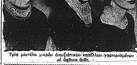
Τρία μοντέλα μικρών ανοιξιατικών καπέλων γυναικείων με άθρονα άνθη.