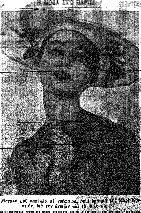
Μεγάλο ρόλο κατέπαιξε με τον... στην... δια την άνοδον και το... κλιμάκιο.

ΟΙ ΕΠΙΣΚΟΠΟΙ "ΔΙΕΦΘΗΡΞΑΝ" ΚΑΙ ΑΥΤΟΙ ΑΠΟ ΤΩΝ ΠΡΑΙΤΙΣΜΩΝ ΚΑΙ ΖΟΥΝ ΠΛΕΟΝ ΩΣ... ΑΝΘΡΩΠΟΙ