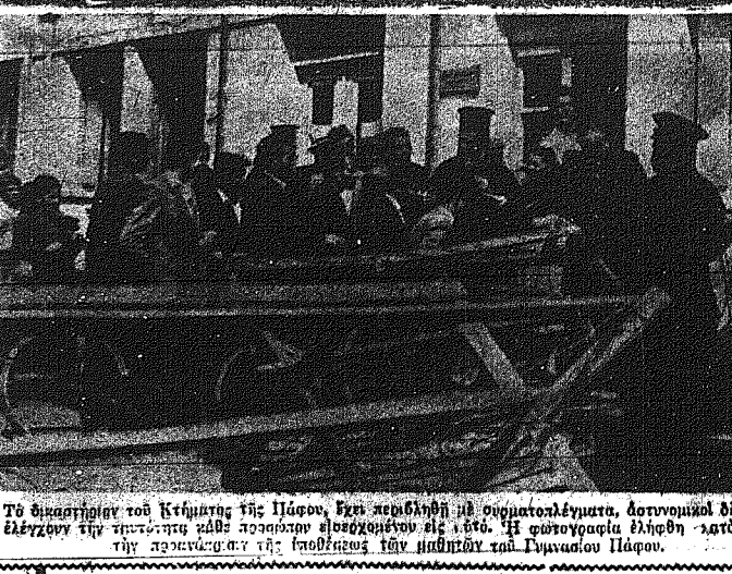
Το διασημότερο του Κρήθιου της Πάρου, έχει περιβληθεί με ορειανολόγους, αστρονόμους...