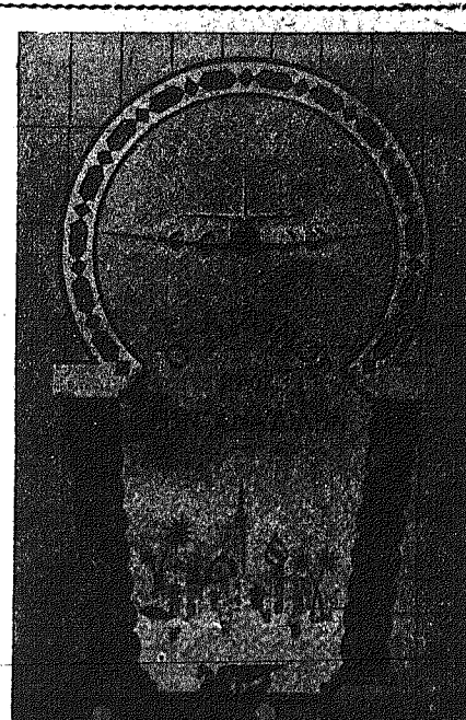
ΑΛΕΞ - BAGDAD - BEYROUTH DJEDDAH - ISTANBUL - JERUSALEM KOWAIT - CAIRO - NICOSIA