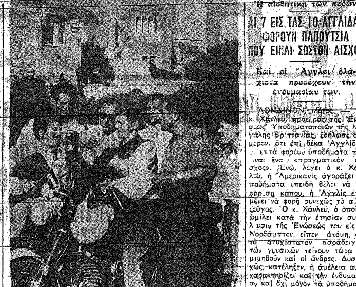
Χορω ήλλητων ολλέγει κατά από την Αρσινόην και το Γάλα μίση σε ένα φεστίβαλ...