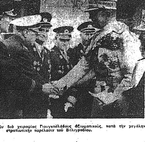
Ο Βασιλεύς Παύλος χαϊρετών δια χειροφίλιας Γιουγκοσλάβους αξιωματούχους, κατά την μεγάλην στρατιωτικήν παρέλασιν του Βελιγραδίου.

ΠΛΗΡΗΣ ΠΕΡΙΓΡΑΦΗ ΤΗΣ ΕΦΥΛΑΚΤΙΚΗΣ ΝΥΚΤΟΣ ΤΗΣ ΚΥΠΡΟΕΩΣ ΤΟΥΡΚΙΚΟΣ ΟΧΛΟΣ ΕΔΡΑΣΕΝ ΕΠΙ ΤΗ ΒΑΣΕΙ ΟΡΓΑΝΩΜΕΝΟΥ ΣΧΕΔΙΟΥ ΜΕ ΚΡΑΥΓΑΣ "ΘΑΝΑΤΟΣ ΕΙΣ ΤΟΥΣ ΚΤΙΣΜΟΥΣ" ΚΑΤΕΣΤΡΕΨΑΝ ΤΟ ΠΛΗΝ ΚΑΙ ΕΠΥΡΩΘΙΣΑΝ ΕΚΚΛΗΣΙΑΣ ΥΠΟ ΤΑ ΧΑΜΟΓΑΛΑ ΤΑΣ ΑΣΤΥΝΟΜΙΑΣ