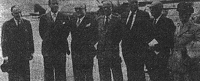
ΑΠΟ ΤΗΝ ΑΦΙΞΗΝ ΤΗΣ ΕΛΛΗΝΙΚΗΣ ΑΝΤΙΠΡΟΣΩΠΕΙΑΣ ΕΙΣ ΤΗΝ ΑΕΡΟΔΡΟΜΟΝ ΤΟΥ ΛΟΔΙΑΝΟΥ. Ο Α' αντιπρόεδρος της Ελλάδος κ. Στ. Στεφανόπουλος και ο κ.κ. Βουρμπουλάς...