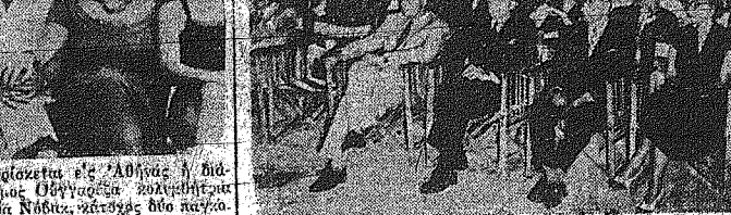
Ενα σκεπασμένο από την αποστολή των Ελλήνων της ελληνικής φωτογραφικής έκθεσης...