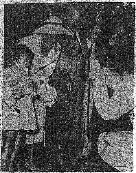
Από την βασιλική οικογένεια, η οποία έδωκε ενδεικτικό όνομα στο θέατρο του Βελγίου...