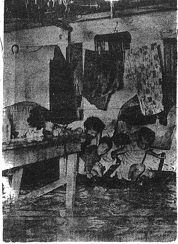
Τα ύβαστα κατέκλυσαν λαϊκές οικίες προαστείων των Αθηνών. Ανωτέρω μία χαρακτηριστική εικόνα.