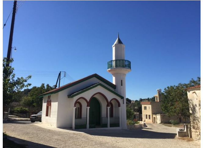
Πρώην εκκλησία Παναγίας Παντάνασσας, Χούλου