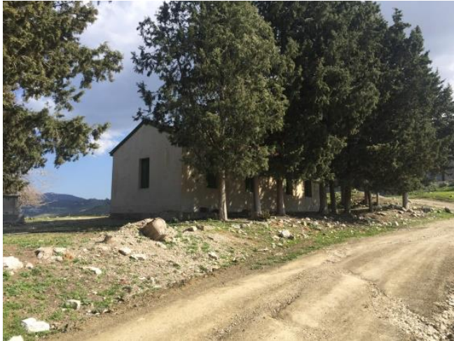
Πρώην εκκλησία αγίου Κυρίκου, Λαπηθιού