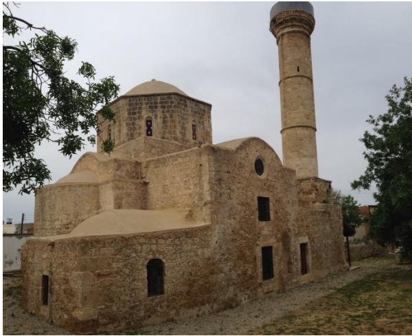
Πρώην καθεδρικός ναός αγίου Φιλαγρίου, Πάφος