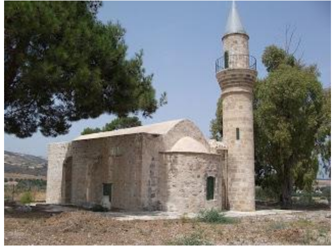
Πρώην εκκλησία αγίου Νικολάου, Χρυσοχού