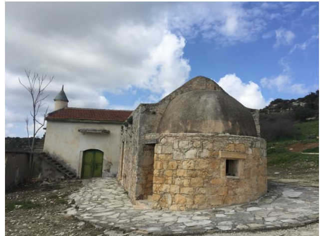
Εκκλησία αγίου Νικολάου, Μελάντρα. Κατά την τουρκοκρατία μετατράπηκε σε σάβλο εξυπηρετώντας προφανώς τις ανάγκες στο δίπλα τζαμί.