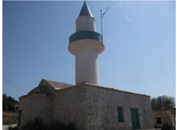
Πρώην εκκλησία αγίας Αικατερίνης, Πελαθούσα