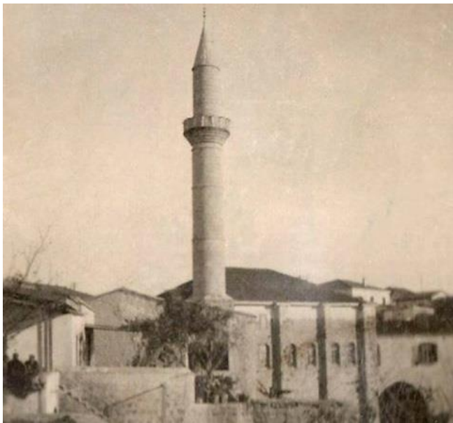
Γενί τζαμί (νέο τζαμί) βομβαρδίστηκε το 1964, Πάφος.