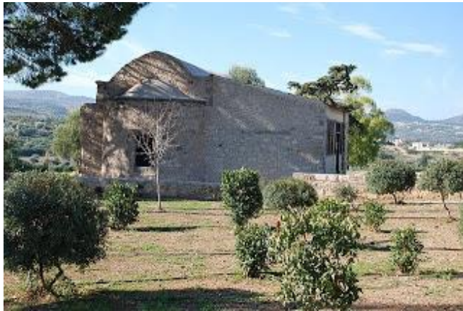
Πρώην εκκλησία αγίου Ανδρονίκου, Πόλη Χρυσοχούς