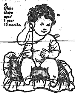
Παιδίον τρεφόμενον διά ΓΕΛΑΣΟ ηλικίας 10 μηνών.

Πωλούνται και επί πιστώσει παρεχομένων μεγάλων εύκολιών περι την πληρωμήν. (4-4)