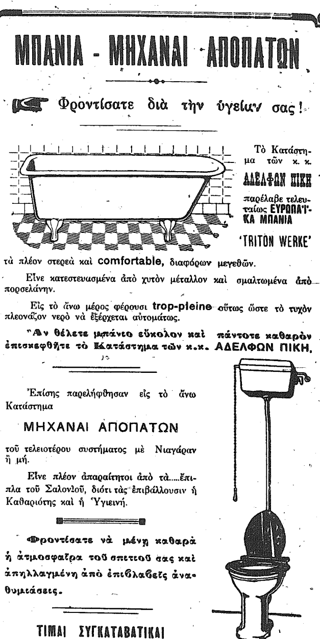
Το Κατάστημα τὸν κ. κ. ΑΔΕΛΦΩΝ ΠΙΚΗ