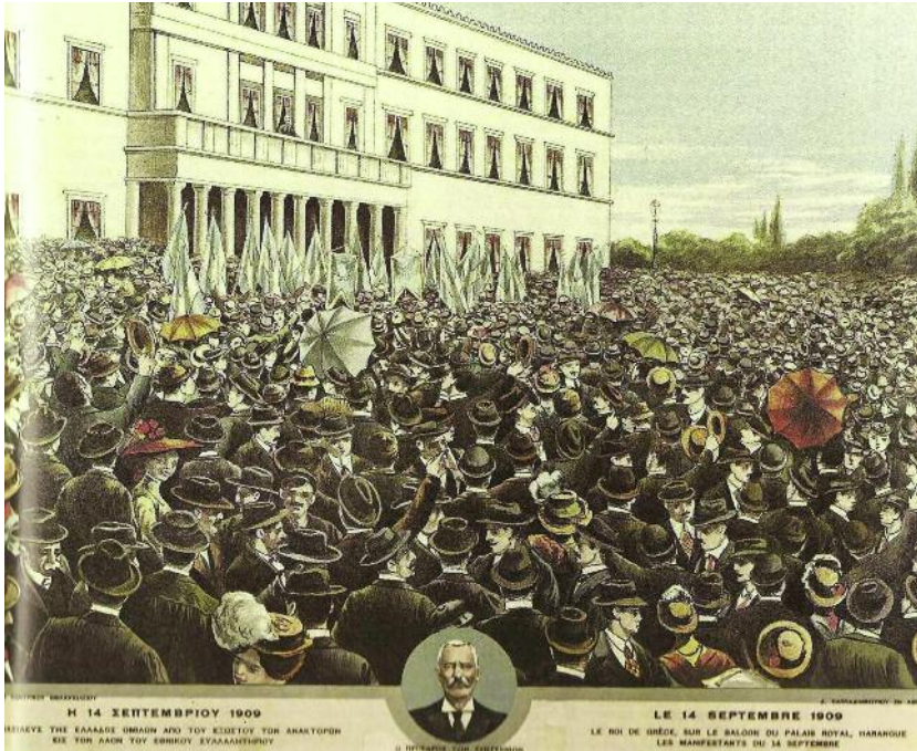
Συλλαλητήριο στην Αθήνα για την υποστήριξη των πρωτοβουλιών του Στρατιωτικού Συνδέσμου (Σεπτέμβριος 1909)

Η χειρονομία καλής θέλησης του Βενιζέλου απέναντι στο θρόνο απέδρεε σε μεγάλο βαθμό από την εκτίμηση ότι η εξασφάλιση της υποστήριξης του Γεωργίου Α΄ αποτελούσε απαραίτητη προϋπόθεση για την επιτυχία του ανανεωτικού εγχειρήματος που ευαγγελιζόταν ο Κρητικός πολιτικός. Διακρίνοντας τη δυνατότητα τερματισμού της πολιτικής κρίσης που ταλάνιζε την Ελλάδα για περισσότερο από ένα χρόνο, ο Βασιλιάς αποφάσισε να ανταποκριθεί στα ανοίγματα του Βενιζέλου, στον οποίο ανέθεσε τον Οκτώβριο του 1910 το