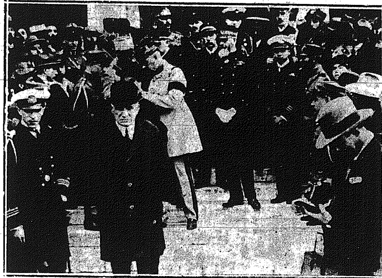
Οι ἐπίσημοι, ἐν οἷς καὶ ὁ Γαλλὸς ναύαρχος Νιέ Μπού, ἐξερχόμενοι τῆς Μητροπόλεως μετὰ τὸ μνημόσυνον.

ΑΠΟ ΤΟ ΜΝΗΜΟΣΥΝΟΝ ΤΩΝ ΠΕΣΟΝΤΩΝ ΚΑΤΑ ΤΟΥΣ ΤΕΛΕΥΤΑΙΟΥΣ ΠΟΛΕΜΟΥΣ ΑΙΣΙΟΜΑΤΙΚΩΝ ΚΑΙ ΟΠΑΙΤΩΝ