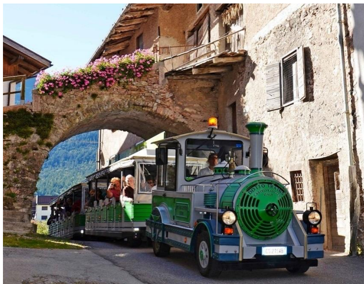
Εικόνα 5B.1 Τροχοφόρο τρένο

Η προτεινόμενη επένδυση αναφέρεται στην αγορά και δρομολόγηση δύο τροχοφόρων τρένων στους δημαρχούμενους Δήμους της Πάφου και Γεροσκήπου για την μεταφορά με άνεση και ασφάλεια καθώς και την ποιοτική και αναβαθμισμένη ξενάγηση που θα πραγματοποιείται με πιστοποιημένους και έμπειρους ξεναγούς στους επισκέπτες /τουρίστες και όχι μόνο.