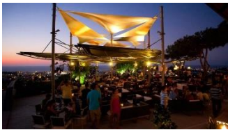
Εικόνα 5B.3 Νυχτερινή Ζωή

Η Πάφος προσφέρει ξεγνοιασιά και χαλάρωση αλλά και έντονες στιγμές νυχτερινής ζωής. Μπαρ, ντίσκο και νυχτερινά κέντρα ικανοποιούν και τους πιο απαιτητικούς επισκέπτες.