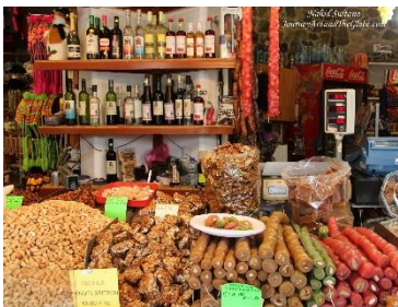
Εικόνα 5B.2 Βιοτεχνίες παραδοσιακών εδεσμάτων

Η Πάφος ένας κατεξοχήν τουριστικός προορισμός μέσα από την Παφίτικη φιλοξενία δημιούργησε την ανάγκη της ανάπτυξης βιοτεχνιών και μικρών εργαστηρίων που συνέβαλαν στην ευρύτερη διάσωση της κυπριακής κουζίνας και των παραδοσιακών εδεσμάτων. Οι βιοτεχνίες και τα εργαστήρια λουκουμιών, κουφέτας αμυγδάλου, παφίτικης πίτσας, σουσούκου, χαρουπόμελου και άλλων παραδοσιακών εδεσμάτων έχουν βραβευτεί κατά διαστήματα σε διεθνείς διαγωνισμούς