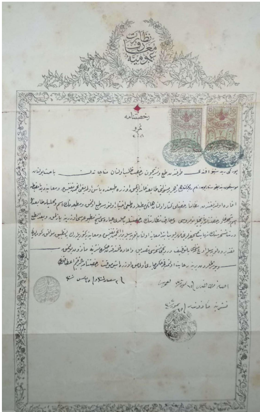
Εικόνα 2. Η άδεια του υπουργείου της δημοσίας Εκπαιδύσεως της Οθωμανικής Αυτοκρατορίας για την έκδοση του Πεντηκοσταρίου του Γεωργίου Ραιδεστηνού (Από το χειρΑΡΣΙΜΑ).