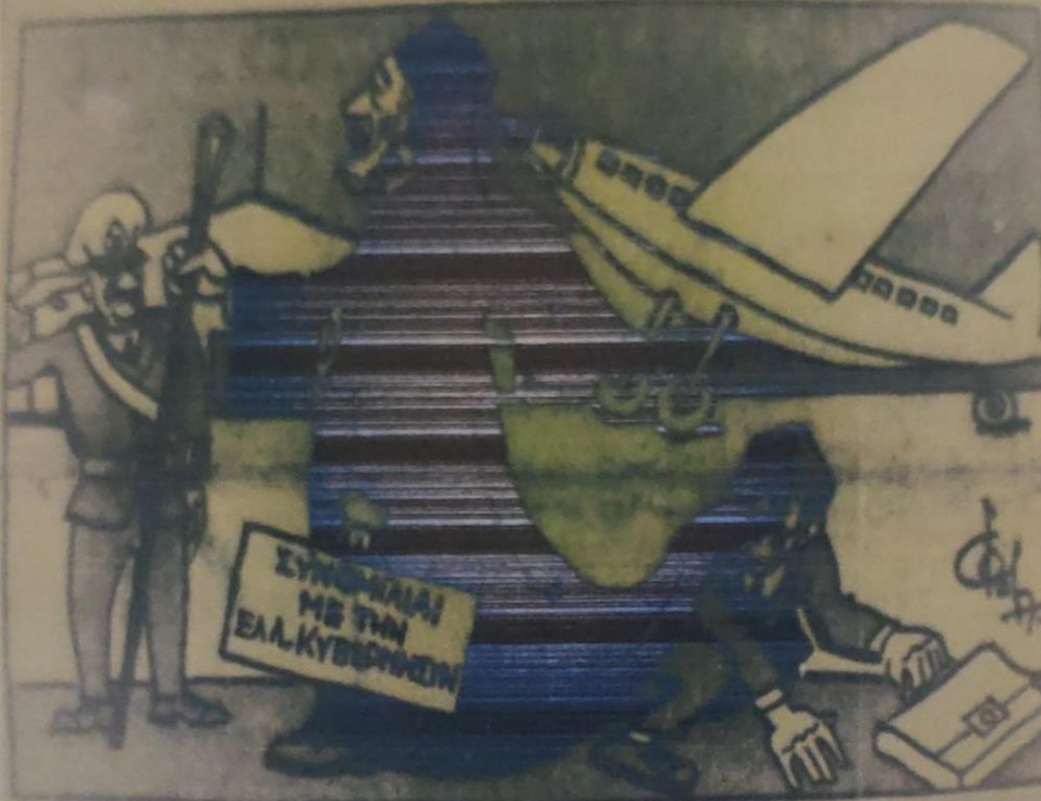
"Εφθάσε ο Μακάριος κι' εξαφανίσθηκε ο Γρίβας